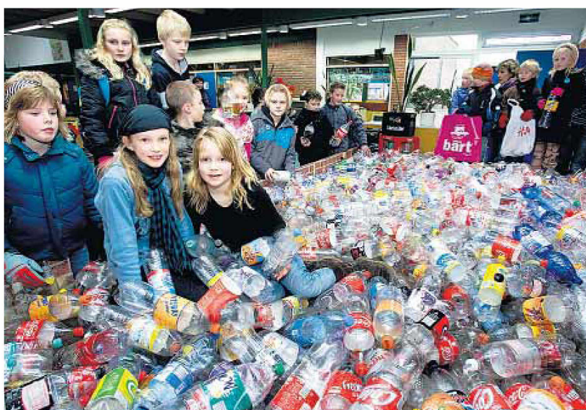
Leerlingen van Het Palet zamelen flessen in.