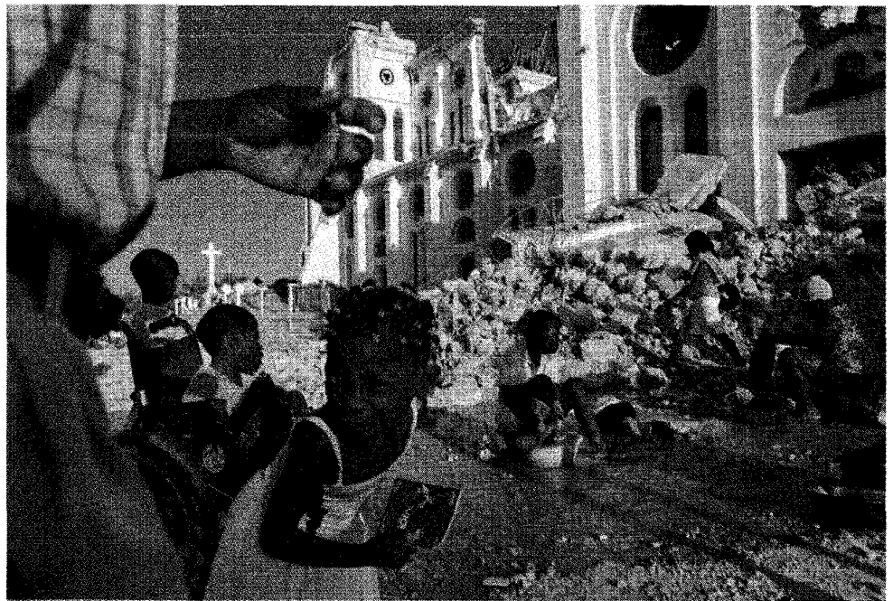
Kinderen spelen, terwijl hun moeders kleren wassen bij een gebroken waterleiding voor de verwoeste kathedraal van Port-au-Prince.

Een gigantisch karwei, maar ook een kans een nieuw Haïti te bouwen 'Ik zie weinig tranen, de mensen hier hebben een enorme veerkracht'