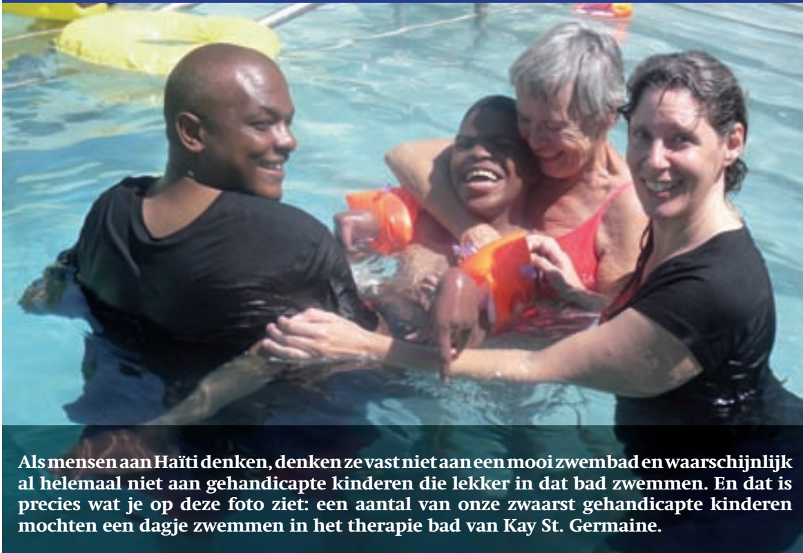
Als mensen aan Haïti denken, denken ze vast niet aan een mooi zwembad en waarschijnlijk al helemaal niet aan gehandicapte kinderen die lekker in dat bad zwemmen. En dat is precies wat je op deze foto ziet: een aantal van onze zwaarst gehandicapte kinderen mochten een dagje zwemmen in het therapie bad van Kay St. Germaine.