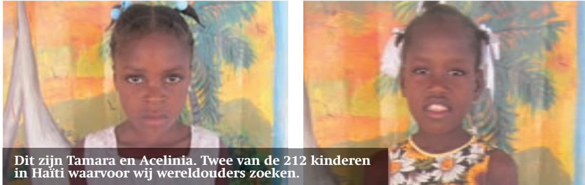
Dit zijn Tamara en Acelinia. Twee van de 212 kinderen in Haïti waarvoor wij wereldouders zoeken.